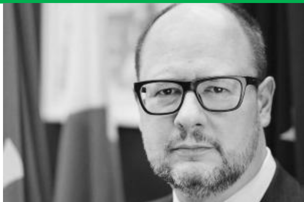
Paweł Adamowicz