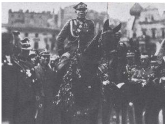
Wojsko polskie na czele z gen. Szeptyckim wkracza do Katowic, 22 czerwca 1922 r.