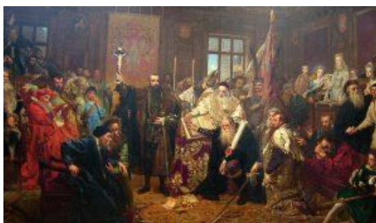
Unia lubelska (obraz Jana Matejki)

100. rocznica urodzin Gustawa Herlinga-Grudzińskiego, pisarza, krytyka literackiego i publicysty.