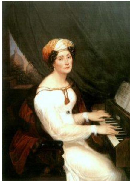
Aleksander Kokular, Portret Marii Szymanowskiej przy fortepianie

220. rocznica urodzin Marii Szymanowskiej, polskiej pianistki i kompozytorki.