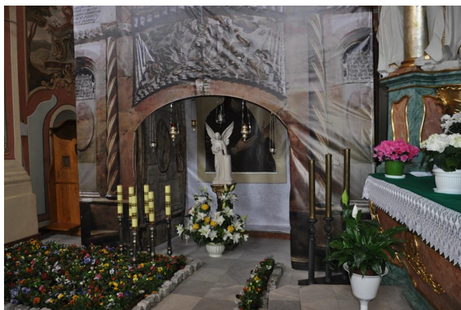
Grób Pański w kościele pw. Św. Antoniego (klasztor)