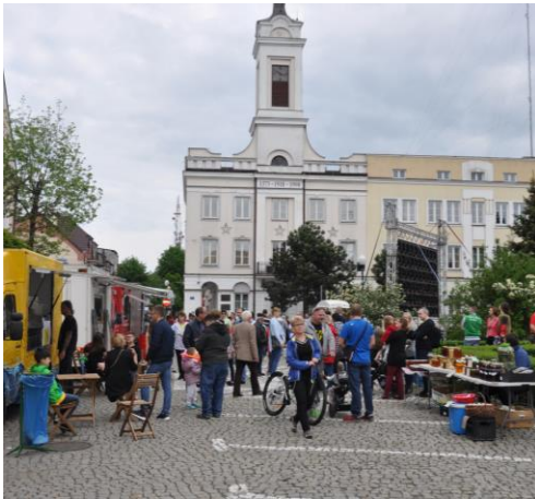
Gościny nikomu nie zabrakło