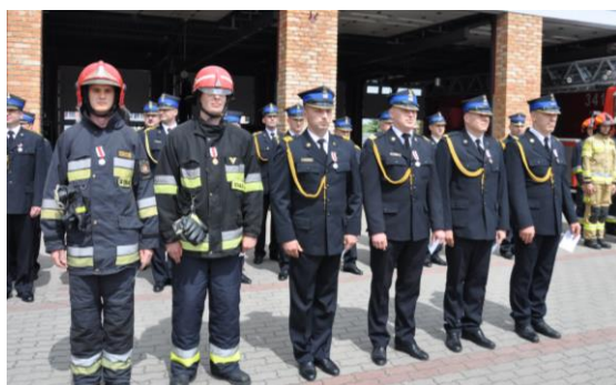
Odnaczeni strażacy PSP i druchowie z OSP