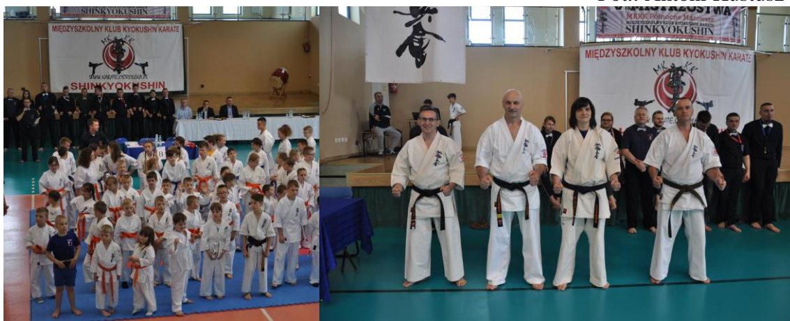
Adepci na zbiorce