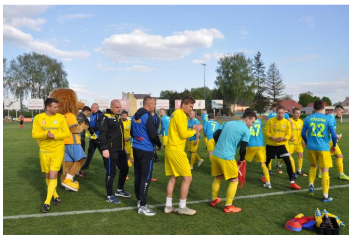
Przed meczem Korona była pełna optymizmu