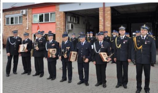
Wyróżnienia dla zasłużonych działaczy OSP