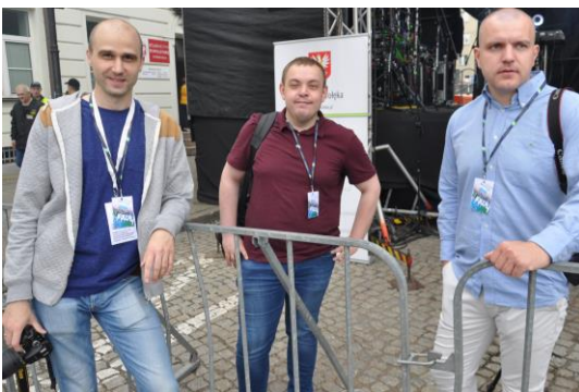
Fotoreporterzy na posterunku

Niedzielną zabawą Ostrołęckiej Majówki pod znakiem Dni Ostrołęki przyciągnęła na plac Bema tłumy mieszkańców i gości. Świetnie bawiły się zarówno dzieci, młodzież, jak i osoby nieco starsze.