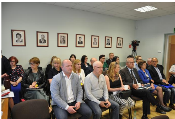
Na zdjęciu: samorządowcy i pracownicy UM

XII sesja Rady Miasta rozpoczęła się od wręczenia podziękowań dla samorządowców z dotychczasowych Rad Osiedli kończącej kadencję 2015 – 2019. W części roboczej Rada Miasta przyjęła uchwałę w sprawie przystąpienia do sporządzenia miejscowego planu zagospodarowania przestrzennego rejonu „Elektrownia C” w Ostrołęce oraz rejonu „Fiełdorfa Nila” w Ostrołęce. Rada rozpatrzyła i przyjęła informację o stanie bezpieczeństwa sanitarnego Miasta Ostrołęki za 2 a także sprawozdania Prezydenta Miasta Ostrołęki z realizacji „Programu współpracy Miasta Ostrołęki z organizacjami pozarządowymi oraz podmiotami, o których mowa w art. 3 ust. 3 ustawy o działalności pożytku publicznego i o wolontariacie na 2018 r.