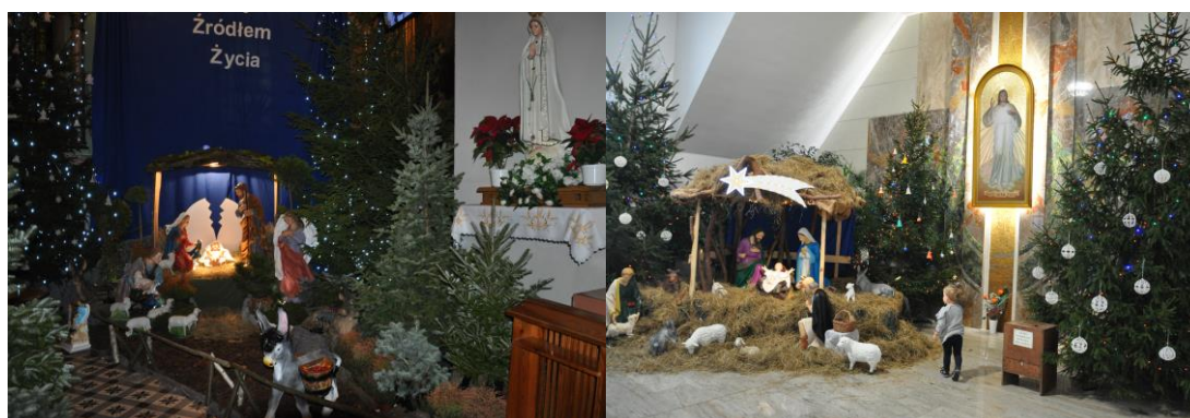
Kościół pw. NNMP (farny)