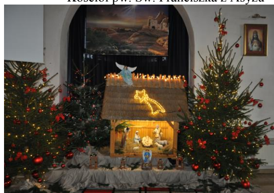
Kościół pw. Zbawiciela Świata