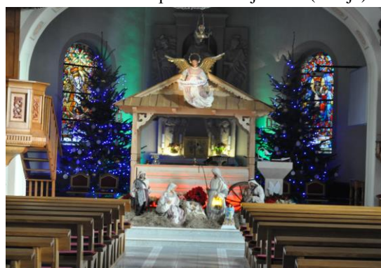
Sanktuarium św. Antoniego (klasztor)