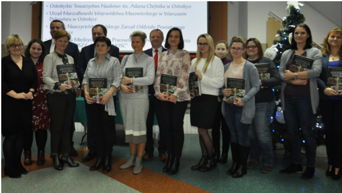
Komisja sprawdzająca dyktando z organizatorami